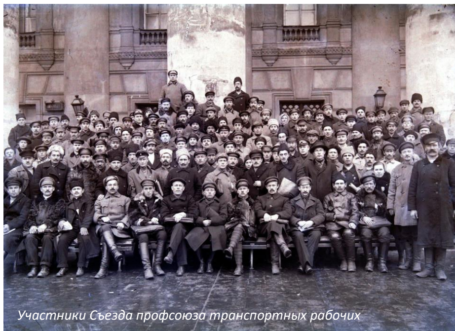
Участники Съезда профсоюза транспортных рабочих

История нашего Профсоюза неотделима от истории государства. Профсоюз прошёл трудный путь становления, испытав на себе в полной мере последствия подъемов и отступлений, побед и неудач, все то, чем богата история нашей страны.