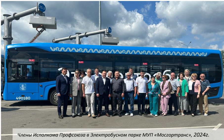
Члены Исполкома Профсоюза в Электробусном парке МУП «Мосгортранс», 2024г.

В настоящее время прочно вошло в практику заключение отраслевых соглашений: