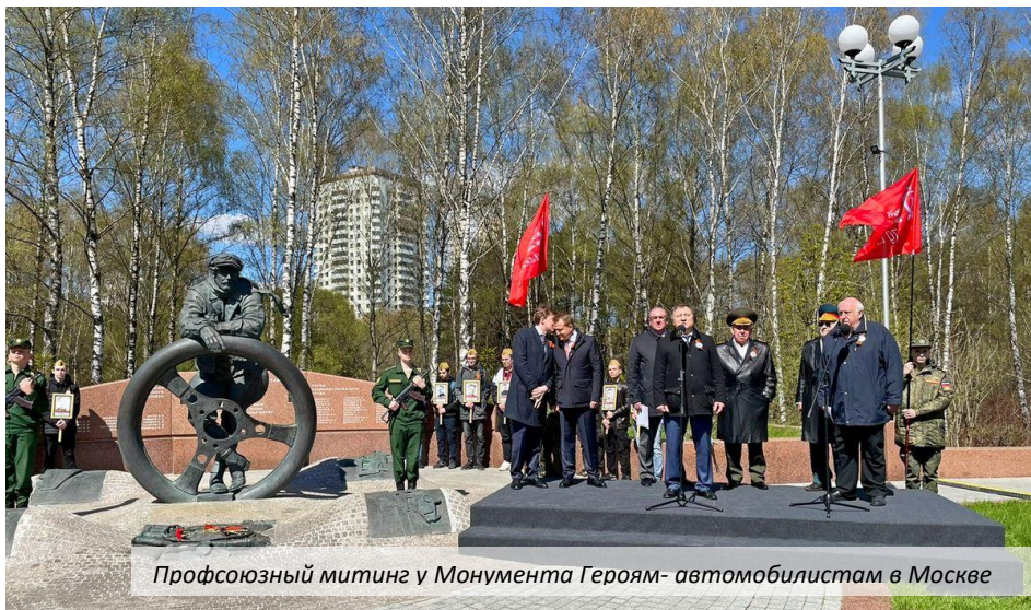
Профсоюзный митинг у Монумента Героям-автомобилистам в Москве

Большую работу по обеспечению автомобильных перевозок в ходе войны выполнили дорожные войска. Их силами и средствами построено, отремонтировано и восстановлено более 100 тыс. км. дорог и