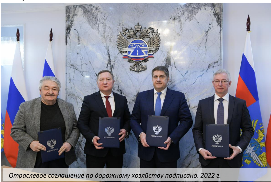
Отраслевое соглашение по дорожному хозяйству подписано. 2022 г.

Получило развитие соревнование водителей за увеличение межремонтного пробега . К концу 1948 года в нем участвовало более 20 тыс.