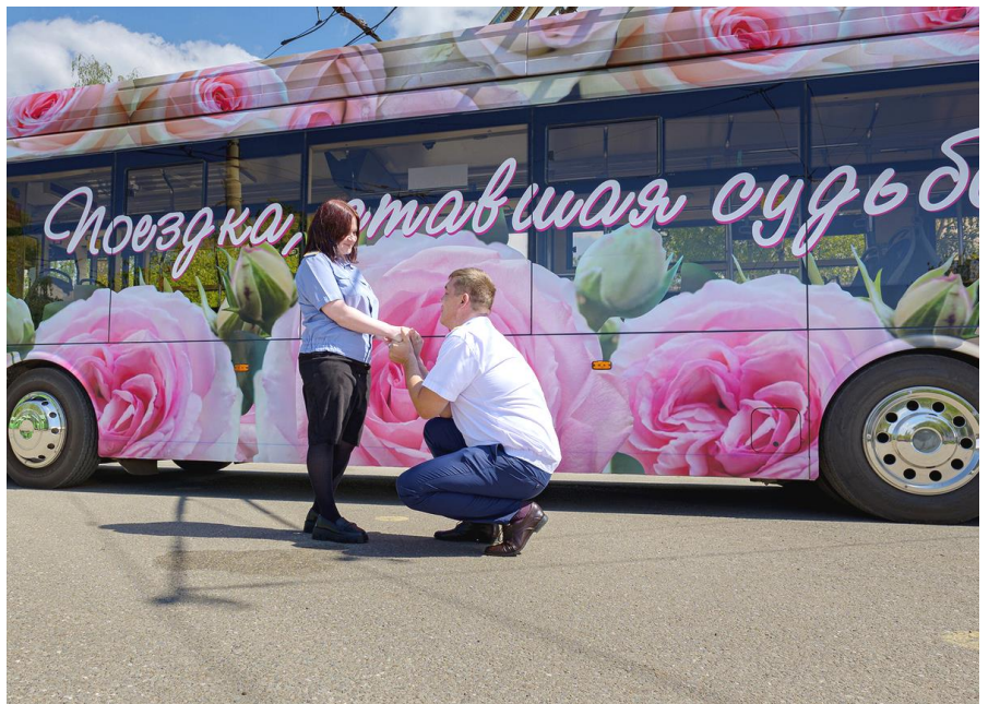
фото и видео работ от Моршанского АТП, Тамбовская территориальная организация Профсоюза;